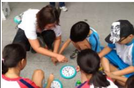
學生實際操作時表法

3-2-2 培養對自然環境的熱愛與對戶外活動的興趣，建立個人對自然環境的責任感。