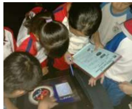
利用硬體展項找出星座與方位關係