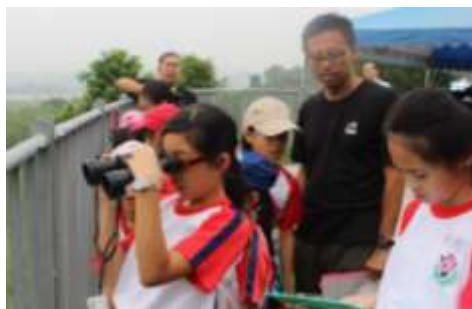
透過雙筒望遠鏡找出遠方字卡內容